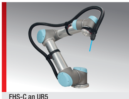
FHS-C an UR5