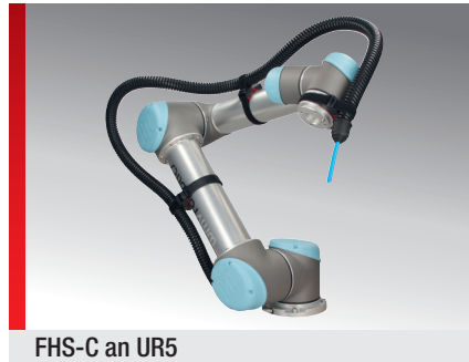
FHS-C an UR5